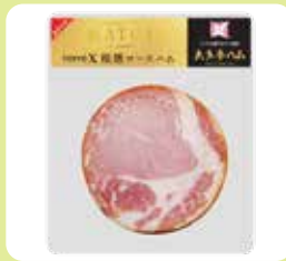
TOKYO X 桜燻ロースハム