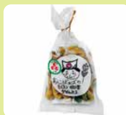
あんこばあばの 手作り明日葉かりんとう