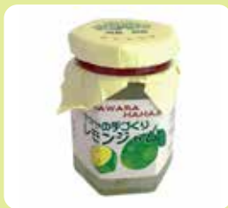
ママヤの手作り レモンジャム