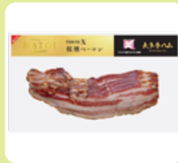
TOKYO X 桜燻ベーコン