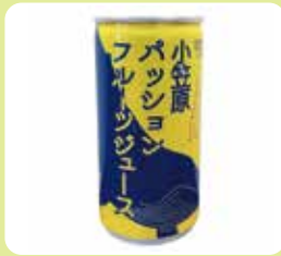
パッションフルーツ ジュース