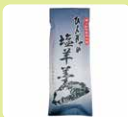
ひんぎゃの塩羊羹