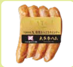
TOKYO X 桜燻あらびきウイナー