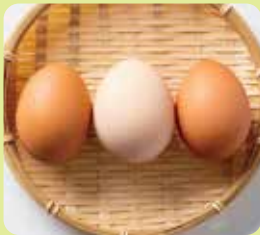
東京烏骨鶏の たまご